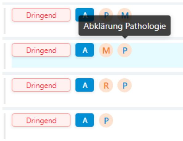
Beispiel für die Anzeige in der Praxisliste