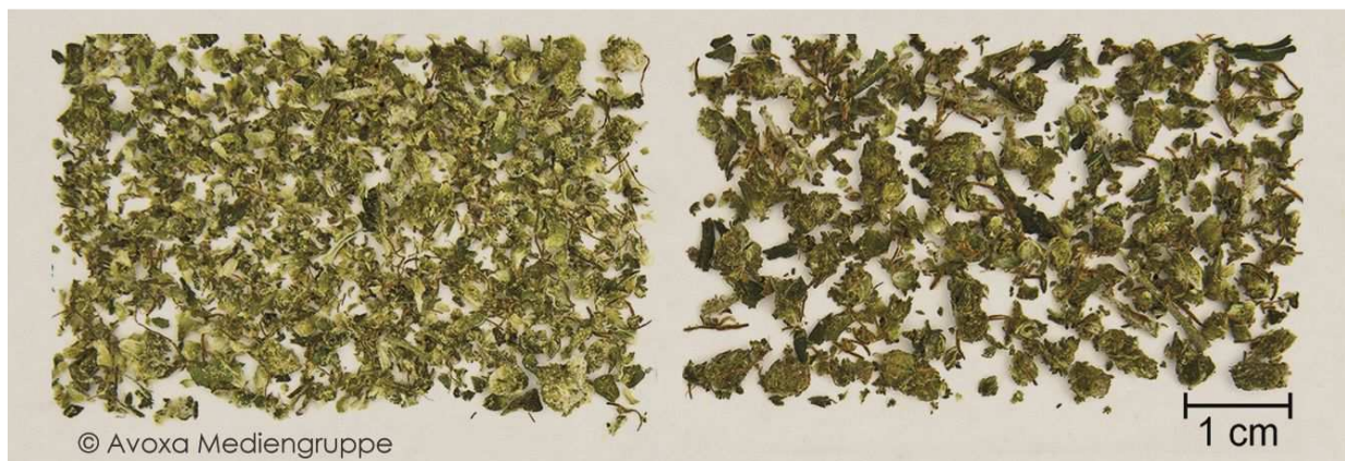
Abb. 2: grob vorzerkleinerte Cannabisblüten