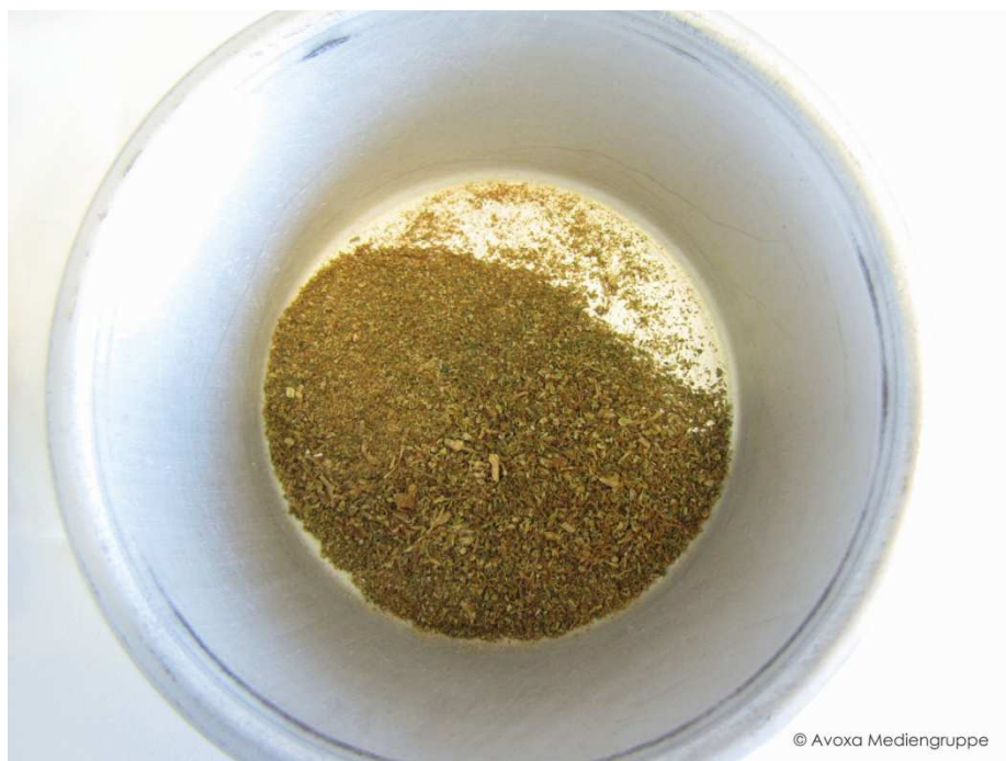
Abb. 3: in der Apotheke gemahlene und gesiebte Cannabisblüten

In Abhängigkeit der Varietät (Sorte) haben Cannabisblüten unterschiedliche Gehalte an Cannabinoiden, insbesondere den Leitsubstanzen \Delta^9 -Tetrahydrocannabinol (THC) und Cannabidiol (CBD). Die Angabe „Cannabisblüten“ auf einem Betäubungsmittelrezept ist daher nicht ausreichend, um das Betäubungsmittel eindeutig zu bestimmen. Vielmehr muss in jedem Fall die Sorte angegeben werden.