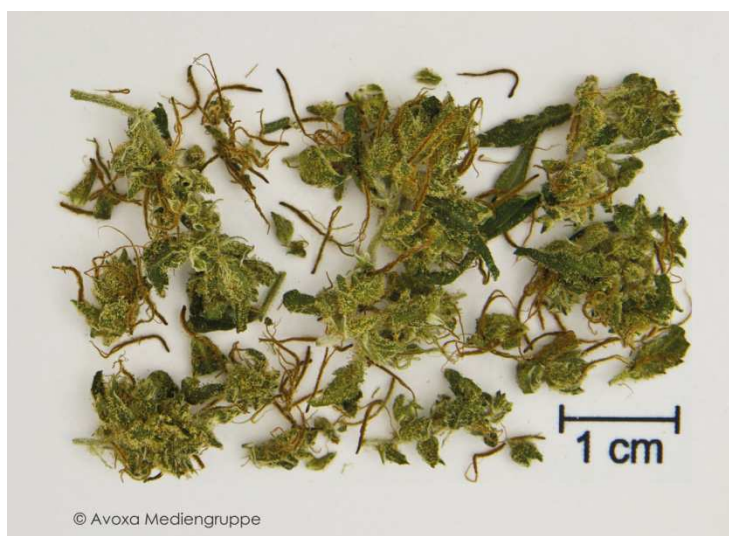
Abb. 1: Originalgröße der Ganz- und Schnittdroge

Cannabisblüten sind die blühenden, getrockneten, Triebspitzen der weiblichen Pflanze von Cannabis sativa L. Bei der handelsüblichen Ware liegen die Blütenstände unzerteilt vor oder sind mehr oder weniger in ihre Einzelteile zerfallen. Die Blütenstände bilden eine stark gestauchte Rispe von etwa 1 bis 5 cm Länge und Breite (Abb. 1). Bei zerfallener Droge sind die Fragmente der Rispe bis zu 1 cm lang. Cannabisblüten zur medizinischen Anwendung müssen daher mit Blick auf die Dosierungsgenauigkeit vor der Anwendung zerkleinert und gesiebt werden. Auch grob vorzerteilte Cannabisblüten eignen sich für die ausreichend niedrige, reproduzierbare und der medizinischen Notwendigkeit entsprechende Therapie nicht (Abb. 2). Nach Mahlen mit einer Kräutermühle und Siebung durch ein 2-mm-Sieb können Cannabisblüten – einzeldosiert oder in Kombination mit geeigneter Dosierhilfe – zur medizinischen Behandlung an den Patienten abgegeben werden (Abb. 3).