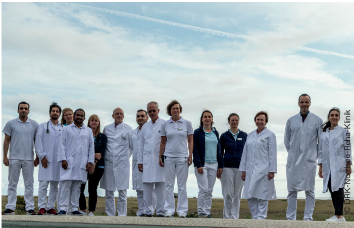
Das interdisziplinäre Team aus ÄrztInnen, TherapeutInnen und Pflegekräften betreut mehrfach (chronisch) erkrankte Menschen in allen gesundheitlichen Facetten.

Ziel ist es, die funktionellen Einschränkungen symptomatisch und individuell zu therapieren, um die Weichen für eine Rückkehr in den gewohnten Alltag sowie ins Berufsleben zu stellen.