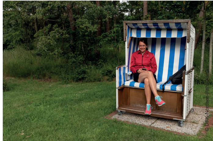
Ruheinseln und frische Nordseeluft erwarten Sie auf dem Klinikgelände unmittelbar hinter dem Nordseedeich und den vorgelagerten Salzwiesen.