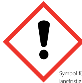
Symbol für reizende, langfristig toxische Stoffe

Um einen sicheren Umgang mit Gefahrstoffen zu gewährleisten, müssen Praxisinhaber gemäß Gefahrstoffverordnung (GefStoffV) die Gefahrstoffe in der Praxis ermitteln und einer Gefährdungsbeurteilung unterziehen.