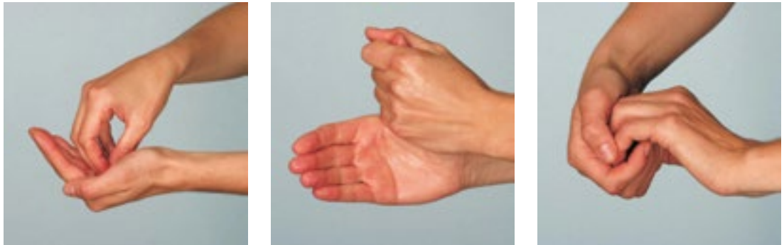
Einreibemethode zur Händedesinfektion in drei Schritten

Besondere Aufmerksamkeit gilt dem Einreiben von Fingerkuppen, Nagelfalz und Daumen.