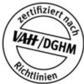
VAH-Prüfsiegel zu Desinfektionsmitteln

Zur Händedesinfektion sollen nur Produkte verwendet werden, deren Wirksamkeit belegt ist, Geprüfte und als wirksam deklarierte Mittel werden z. B. in der Desinfektionsmittel-Liste des VAH (Verbund für angewandte Hygiene e.V.) 1 geführt. Informationen über die VAH-Listung finden sich in der Regel auf dem Produkt selbst bzw. auf dem Produktdatenblatt (siehe Abbildung VAH-Prüfsiegel). Auch bei den Herstellern der Desinfektionsmittel oder den Hygiene-Beratern der Kassenärztlichen Vereinigungen können Informationen über die Listung der Mittel eingeholt werden. Die Verwendung VAH-gelisteter Mittel ist indes nicht rechtlich vorgeschrieben.